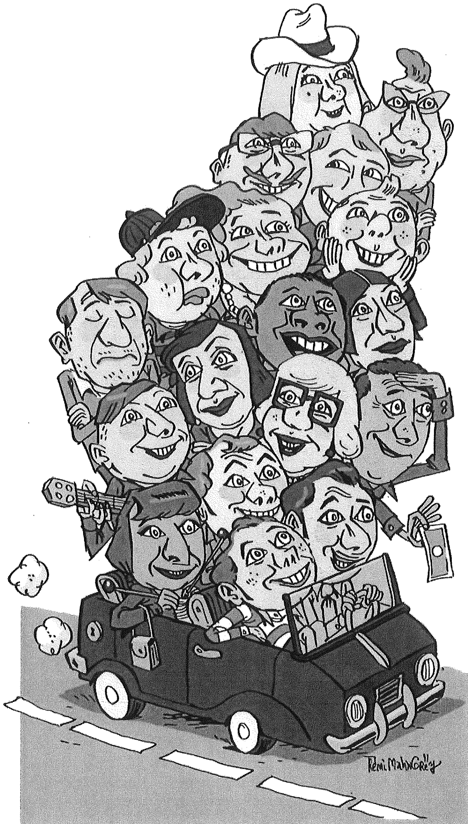
Rémi MALINGREY, dessin paru dans Libération , décembre 2014.

Ce dessin illustre un article de journal consacré au co-voiturage.