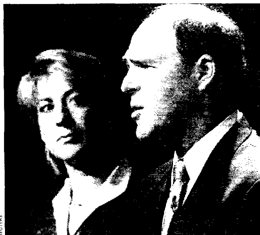
Carly Fiorina, P-DG de Hewlett-Packard et Michael Capellas P-DG de Compaq. Chacun de ces deux dirigeants est arrivé à la tête de son entreprise en juillet 1999. Réalisée par échanges d'actions, la reprise de Compaq par HP donne naissance à un géant pesant près de 87 milliards de dollars.

Bien sûr, un an après l'échec de la reprise de PriceWaterhouseCoopers, cette opération permet à Hewlett-Packard de renforcer son activité service en mettant la main sur l'ex-Digital. Mais les prestations de service représentent à peine 23% des revenus de Compaq et proviennent en grande partie d'activités de maintenance, d'installation ou de support. Bref pas de consulting ni de services applicatifs donc pas de quoi hisser Hewlett-Packard au niveau d'un IBM. Au total, les services ne représenteront qu'à peine 17% du nouvel ensemble contre plus de 30% pour les équipements d'accès (PC de bureau, portables, assistants numériques...). Dans ce contexte, la décision d'Hewlett-Packard a des allures de fuite en avant, voire d'alliance des faibles. Après un premier bilan mitigé à la tête d'HP, Carly Fiorina saura-t-elle la transformer en succès ? ■ Emmanuel GRASLAND